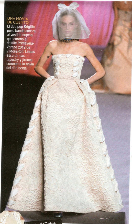
UNA NOVIA DE CUENTO El dúo pop Brigitte puso banda sonora al vestido nupcial que coronó el desfile Primavera-Verano 2012 de Viktor&Rolf. Líneas escultóricas, tapestry y jirones coronan a la novia del dúo belga.